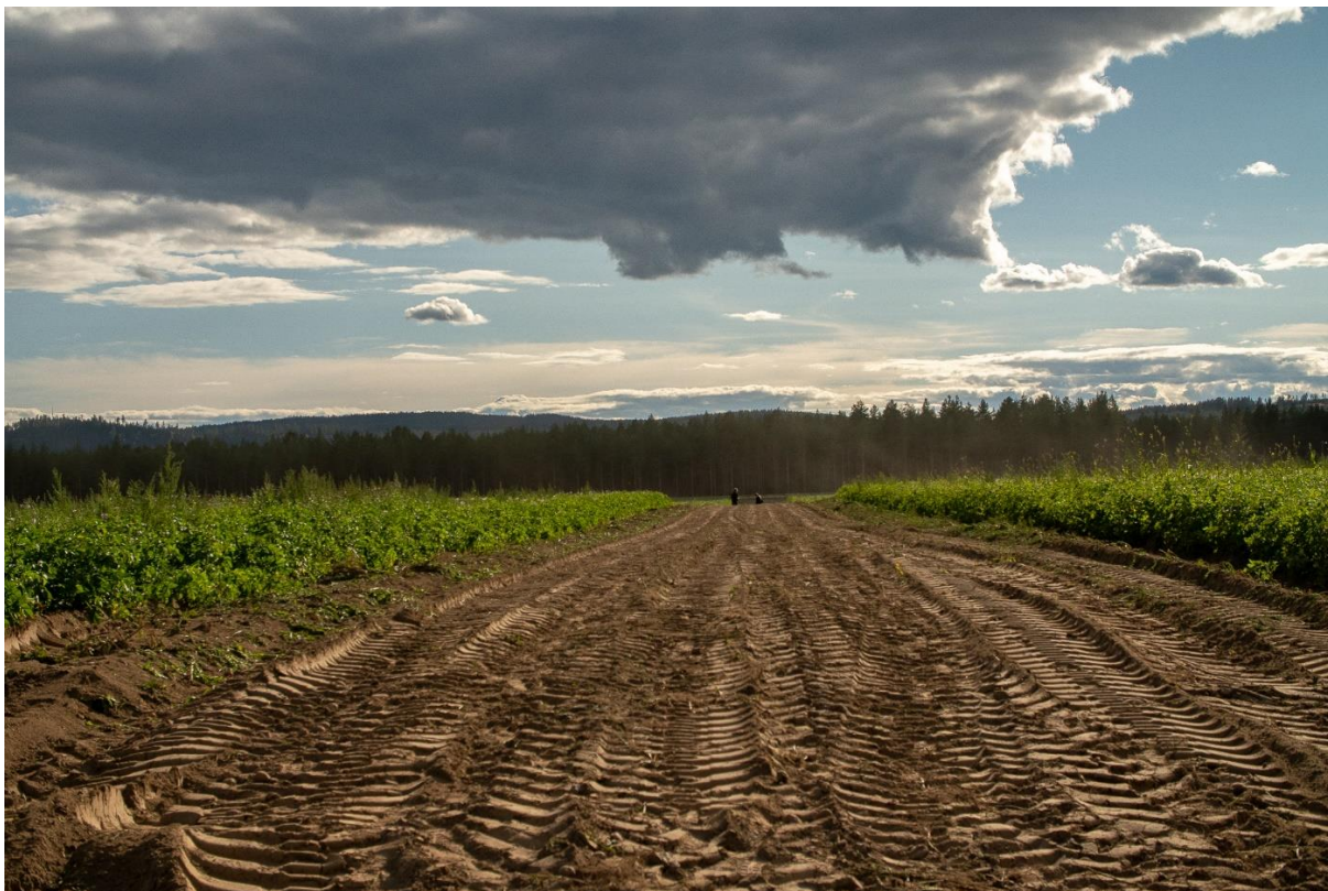
Foto 7: Siste 1/3 av jordet sett mot øst, dvs mot landingsretningen.