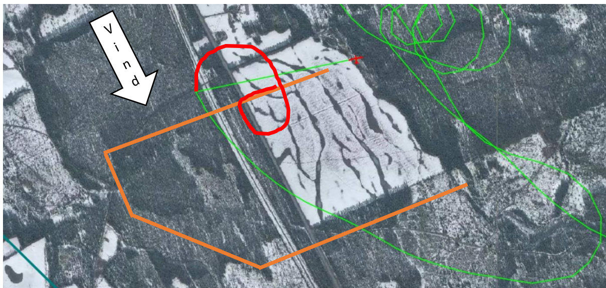
Bilde 2: Grøn linje – aktuell tracklog inkl tapt tidsintervall. Rød linje – tracklog slik fsj beskriver situasjonen. Oransje linje – anbefalt standard innflygingsmønster

Det er åpenbart ved utredningen at energien i landingen har vært høy. Underlaget ved første nedslag er relativt myk sandjord. Mye energi absorberes derfor allerede her. Dersom GIB fortsetter å fly med fulle luftbremsere i ytterligere 120m forteller også dette om mye energi. Etter nok et nedslag mot ytterkant av jordet er det fortsatt energi til å kutte bjørkeetrær før det stopper i tjernet.