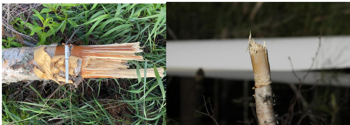
Foto 2 og 3: Bjørketrær kuttet av vingen til LN-GIB, diameter ca. 10-15cm

Haleseksjonen og kroppens bakre del samt stabilisator fremstår relativt uskadet.