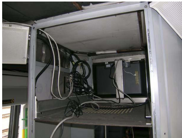
Figur 4: Den ene monitoren er demontert. I rommet mellom monitorene finnes ledninger og utstyr for strømtilførsel og signaltilførsel. Over dette rommet finnes varme- og kjøleelementene i togets HVAC-anlegg.

I taket over bagasjesøylen finnes HVAC 1 anlegget med luftkanal og varme- og kjøleelementer plassert om lag rett over rommet mellom monitorene. Vifter som trekker luft fra luftinntak, over varme- eller kjøleelementer og sprer denne til sitteavdelingene er plassert i taket i vestibylen utenfor bagasjesøylen.