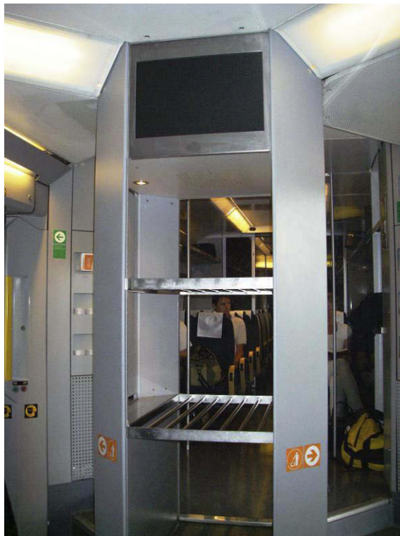
Figur 3: Bagasjesøyle med monitor i togets vestibyle.

transformatorer for strøm til belysning i vestibylen og bagasjesøylen, samt en ruter for signaltilførsel til monitorene.