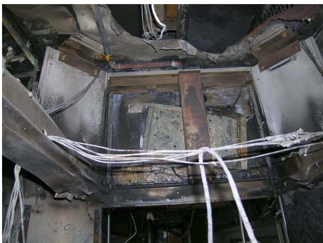
Figur 5: Bakveggen av en monitor etter brannen. I toppen av bilde sees at skilleveggen mot varmeelementene er smeltet.

man utelukke varmeelementet i HVAC anlegget, samt lysarmatur med transformatorer som brannkilder.