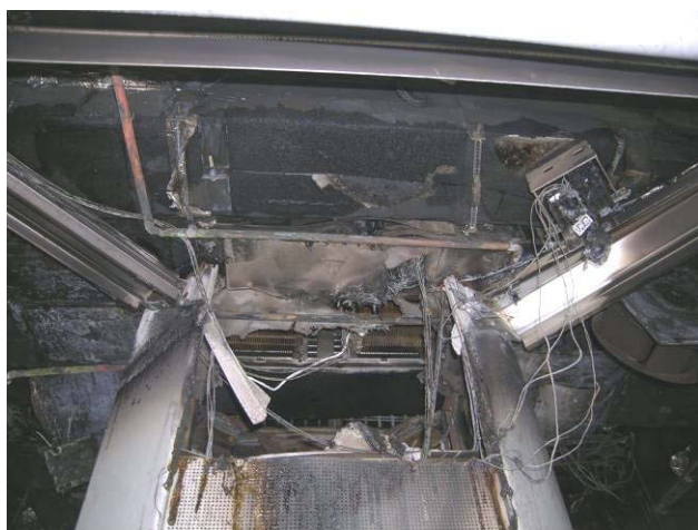
Figur 1 Brannskader i toppen av bagasjesøylen og taket i vestibyle 2 i BM 71003.

Det ble registrert store brannskader i toppen av bagasjesøylen og i taket i vestibyle nr 2 i vogn BM 71003. Videre ble det registrert relativt omfattende røykskader og skader fra slukningsarbeidet i sitteavdelingene i denne vognen. I de øvrige vognene i togsettet ble det registrert noe røykskader.