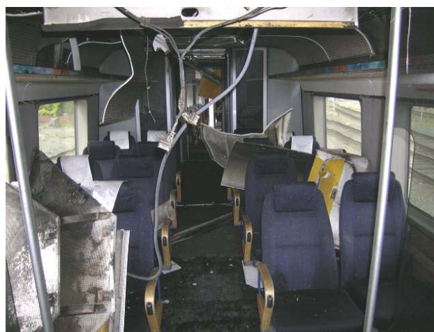
Figur 2 Røykskader og skader etter slukking i passasjeravdeling en i BM 71003.